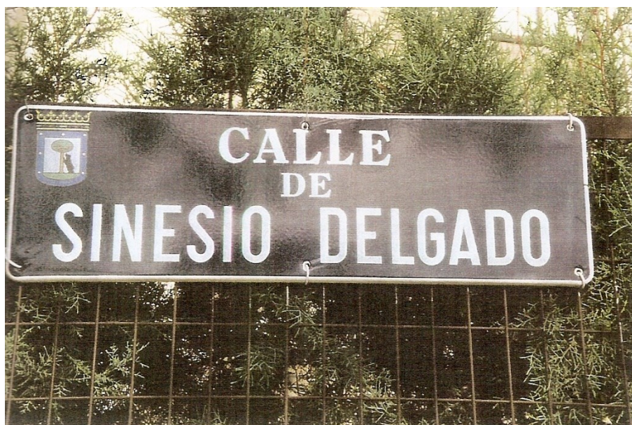
Calle de Madrid que lleva su nombre