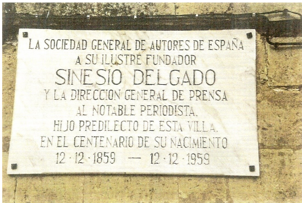
Placa localizada en la casa donde nació, en Palencia